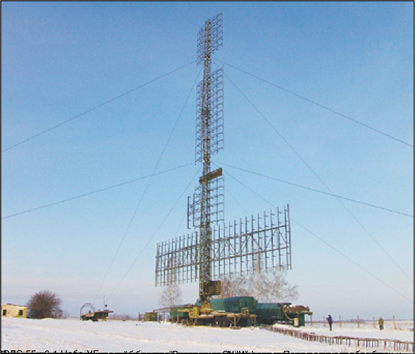
ВВС США в 2011 году обнаружили ракетный пуск с территории Китая в сторону России.

14.07.2012 11:57 - Обновлено 24.05.2013 10:43