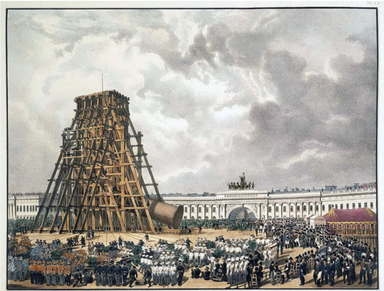
Vue de la plate-forme et de la manœuvre des troupes aux opérations pendant l'érection du canon. 1834 par J. G. G. et Bayle.

Автор: Журнал "Культурная Столица" 11.09.2016 14:29 -