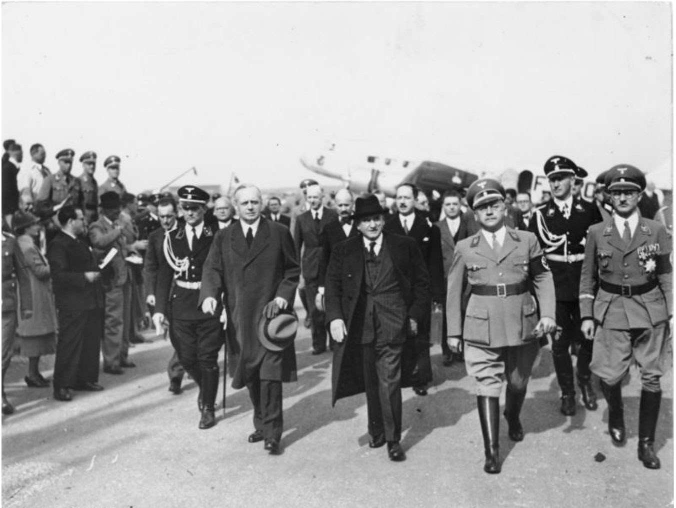
Bundesarchiv, Bild 183-H12946 Foto: a. 909-129, September 1938

Великобритания и Франция не вмешались в дело, а Германия получила свободу действий в Европе.